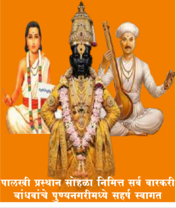
पालरवी प्रस्थान सोहळा निमित्त सर्व वारकरी बांधवांचे पुण्यनगरीमध्ये सहर्ष स्वागत